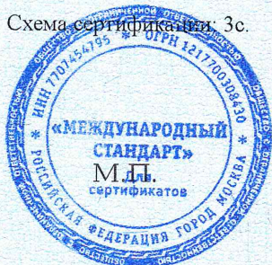
Схема сертификации: 3с.